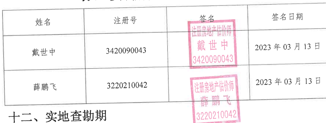
表 6 参加估价的注册房地产估价师